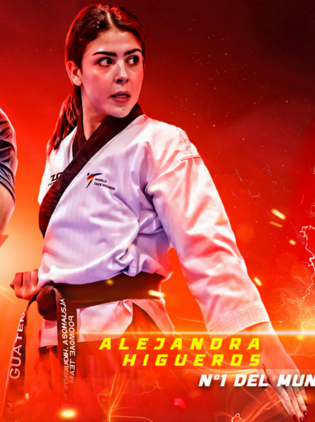
ALEJANDRA HIGUEROS Nº1 DEL MUNDO