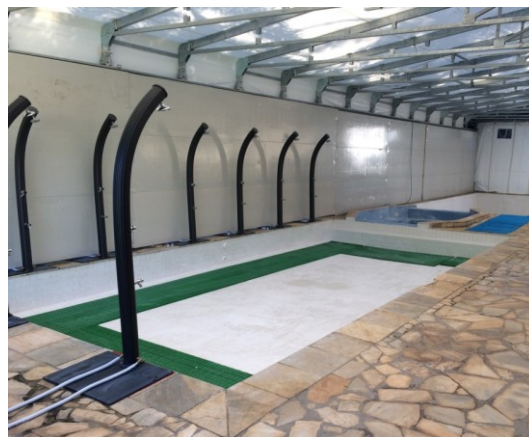
Un'immagine degli AS Roma Campus

BOCCARDELLI, D'UBALDO e MAID: da pagina 2 a pagina 1